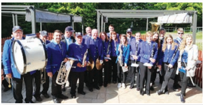
Pihalni orkester Apače

Praznični prvomajski dnevi so se v Varovanem domu Ščavnica v Občini Sveta Ana začeli z glasbo. Takoj po zajtrku jih je presenetil obisk Pihalnega orkestra Apače. S prvomajsko budnico so prebudili prav vsakega, stanovalke in stanovalce kot tudi zaposlene so navdušili z igranjem znanih melodij, ob katerih so tudi zaplesali in navdušeno ploskali. Praznični dan je minil ob številnih obiskih svojcev, ki so popestrili domsko dogajanje. Ker jim je bilo vreme naklonjeno, so ga izkoristili za peko pleskavic na žaru na terasi doma. Člani pihalnega orkestra so nam obljubili ponovno snidenje prihodnje leto in povedali, da jih po vaseh