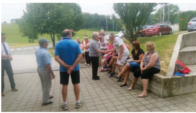
Tone Partljič se rokuje z obiskovalci dogodka v Benediktu.