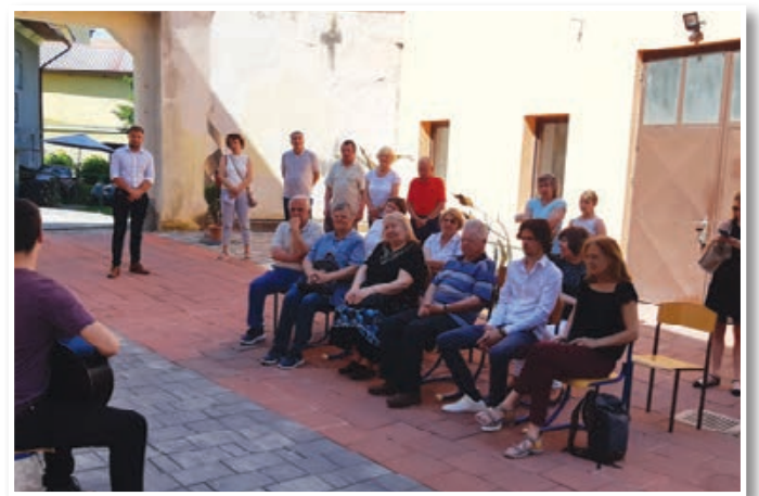
Dvorišče Galerije Dani je prijeten ambient za prireditve.