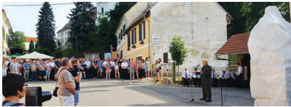
Prireditve ob trojiškem občinskem prazniku so se zile v Trojicafest od 7. do 16. junija, ena osrednih pa je bilo odkritje spomenika Ivanu Cankarju. Str. 8