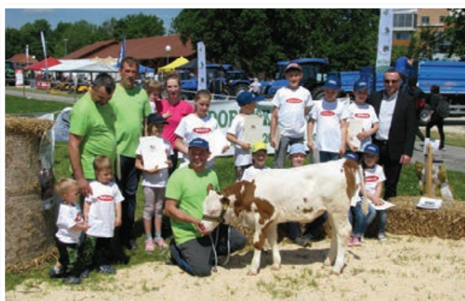
Udeleženci in organizatorji prireditve LISKA