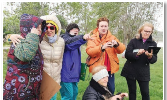
Na obali, pihala je burja ...