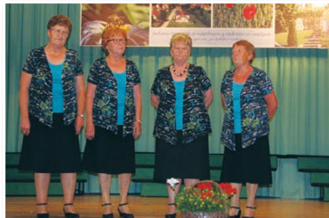
Ljudska pesem je doma tudi v Lenartu, kjer jo neguje skupina pevk pod okriljem DU Lenart.