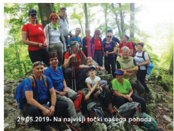
25.05.2019. Na najvišji točki našega pohoda

V vasi Grmače nad Moravčami smo izstopili, se pripravili za pohod in po dvajsetih minutah prispeli do Planinskega doma »Ušte-Žerenk«. Od tu je bil prekrasen razgled na moravško dolino, tja do Kamniških Alp. Tudi postrežba je bila prijazna in kvalitetna, kar manjka marsikateremu gostinskemu lokalu. Nadaljevali smo mimo »ranča« Osole, kjer so nas pozdravili konji ter različne pasme kozic. V nadaljevanju smo prešli na južno stran hribovja, kjer so se nam začeli odpirati pogledi na savsko dolino. Najlepši razgled se nam je ponudil nad kresniškim kamnomlomom, kjer lomijo kamen za proizvodno apna v vasi Kresnice na desnem bregu Save. Na samo vas in dolino reke Save, tja do Litije, se nam je odprl pogled z vzletišča za jadralna padala. Na najvišji točki pohoda, na 880 m