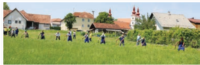
Skupinska košnja, košnja na »štraf«