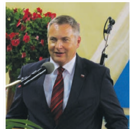
Slavnostni govornik na proslavi je bil mag. Dejan Židan, predsednik Državnega zbora Republike Slovenije.