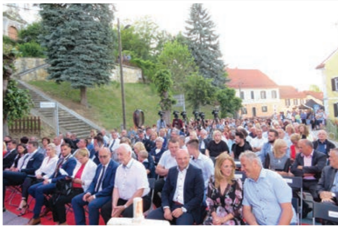
Otvoritvena slovesnost Trojicafesta je potekala v čudovitem ambientu na Trojiškem trgu v središču Svete Trojice, kar ji je dalo še poseben čar.