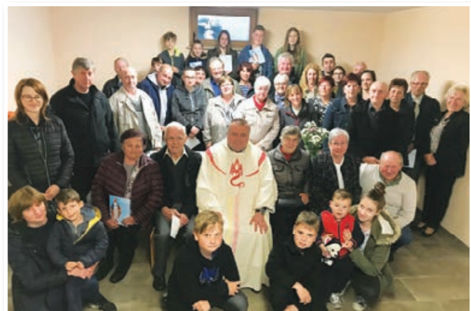
Utrine z zaključnega druženja na domačiji Vuzem