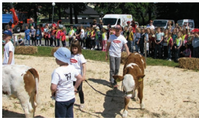
Maneža Liska z najmlajšimi rejci