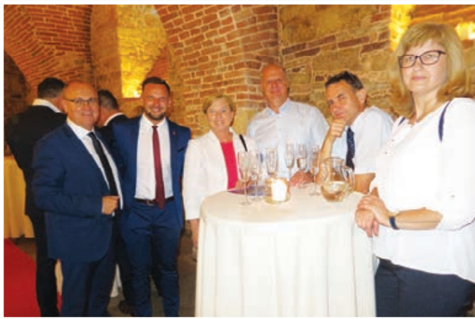
Otvoritve Trojicafesta so se udeležili številni ugledni gosti, ki so se pred otvoritvijo zbrali v samostanski kleti.